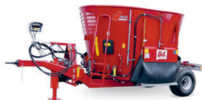
T-Wagen bis 12 m 3