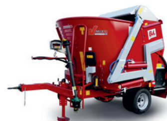
Lade- und Schneidschild bis 25 m 3