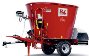
1 Schnecke bis 14 m 3