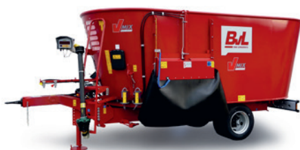
2 und 3 Schnecken bis 46 m 3