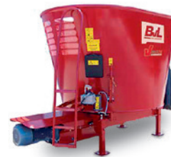
Stationär bis 30 m 3